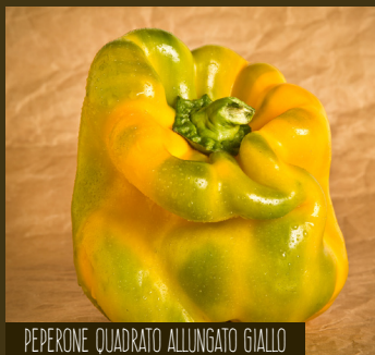
PEPERONE QUADRATO ALLUNGATO GIALLO