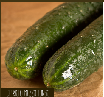
CETRIOLO MEZZO LUNGO