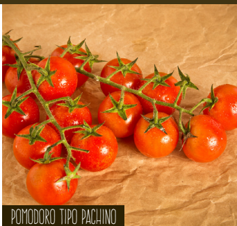
POMODORO TIPO PACHINO