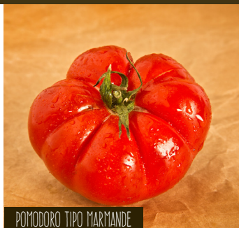
POMODORO TIPO MARMANDE